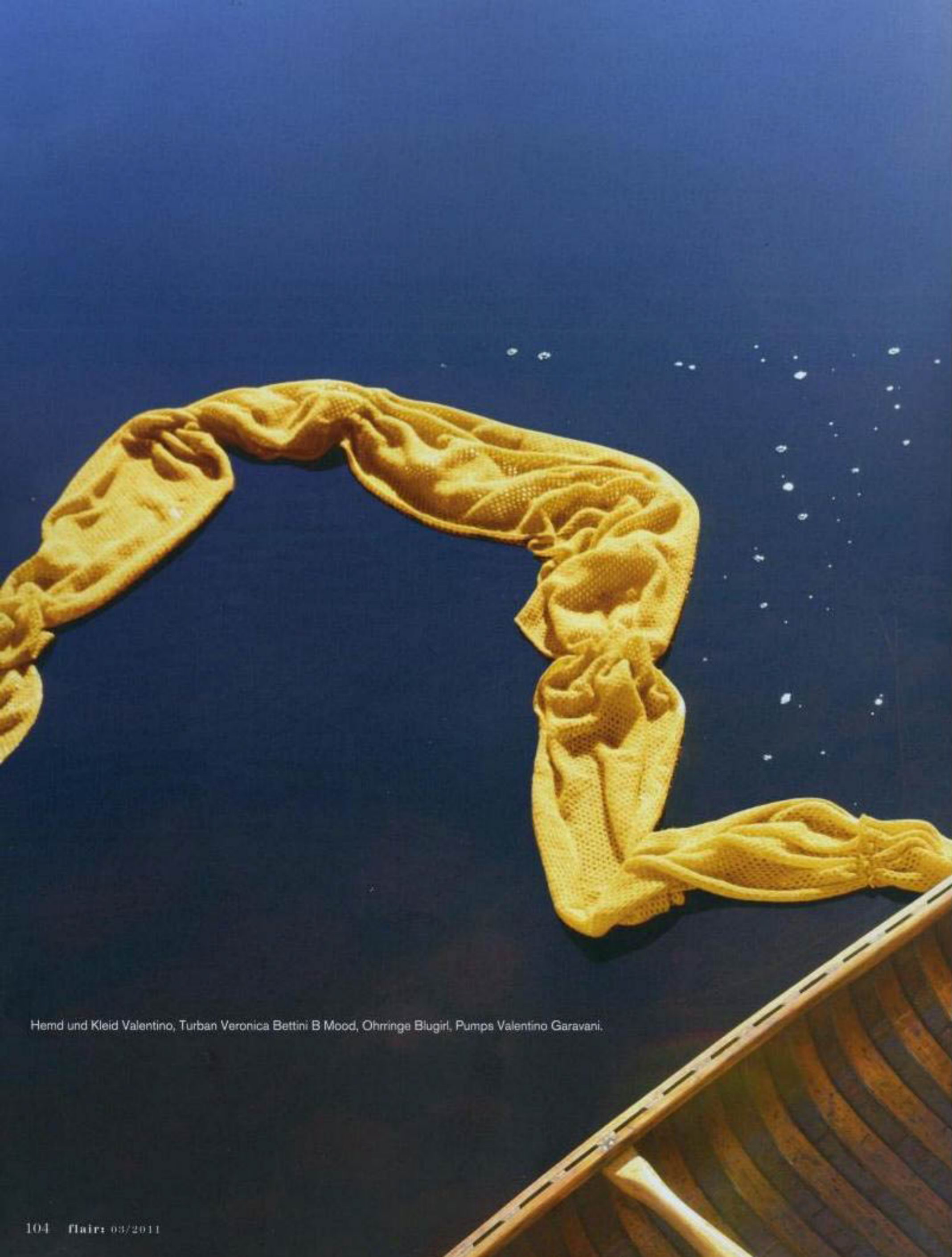
Hemd und Kleid Valentino, Turban Veronica Bettini B Mood, Ohrringe Blugirl, Pumps Valentino Garavani.